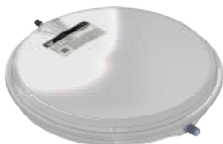
Disegno / Drawing 521 - 521/XL