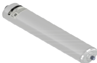
Disegno / Drawing 564