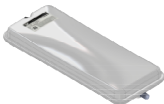
Disegno / Drawing 539/XL