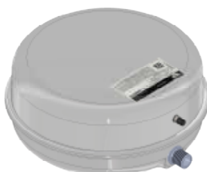
Disegno / Drawing 541/L