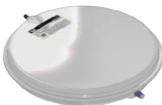
Disegno / Drawing 522/L