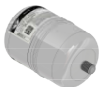
Disegno / Drawing 20016