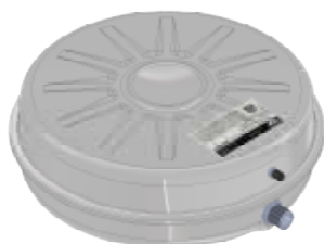
Disegno / Drawing 531/L