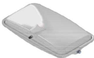
Disegno / Drawing 539/L