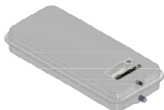
Disegno / Drawing 518