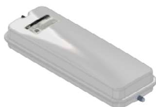
Disegno / Drawing 537/XL