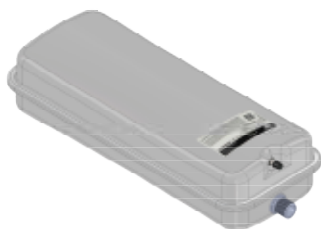
Disegno / Drawing 537/L